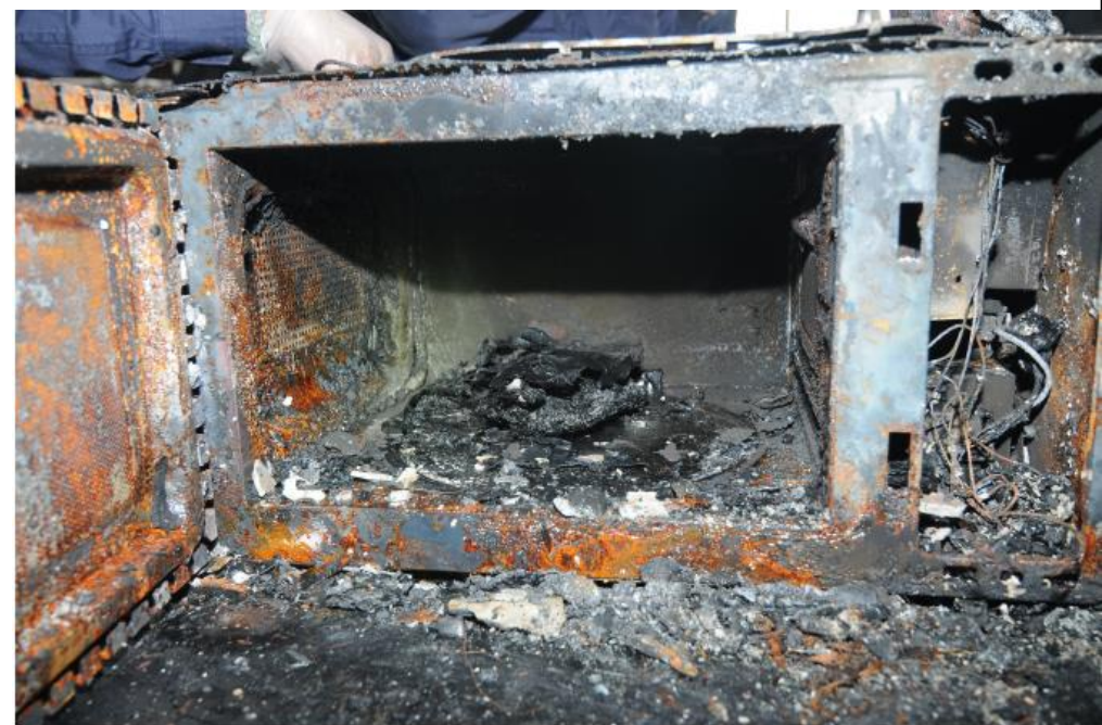
微波爐內部有受燒碳化嚴重之長方形紙盒。